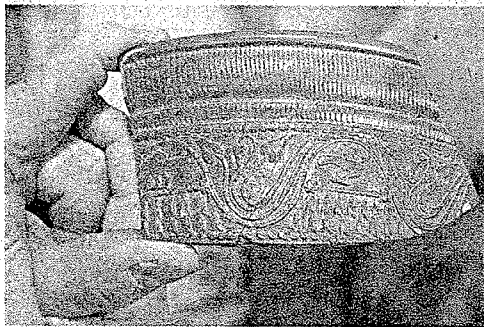
Les archéologues vont maintenant laver, trier et reconstituer les pièces trouvées rue de l'École.

●●● Les récentes fouilles effectuées rue de l'École par « Archihw » ont permis de prouver que Horbourg avait été occupée très tôt par les Romains. Les archéologues ont notamment mis au jour un mur en moellons de l'époque claudienne.